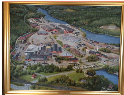
Målad av Ebbe Skoglund med en vy över Järnverket.

Vi gav som avskeds gåva till Leif Rosèn en tavla från samtliga anställda.